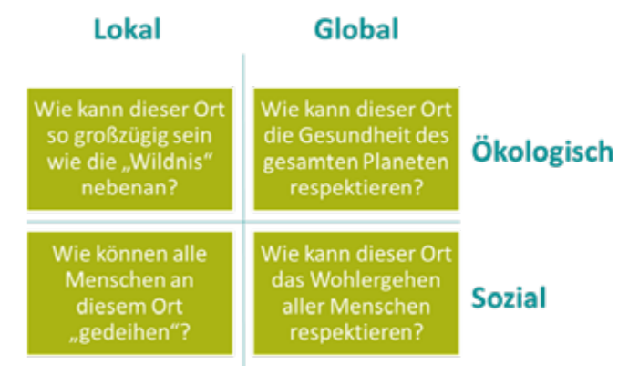
Abbildung 2: Die vier Linsen des City-Porträts (eigene Darstellung in Anlehnung an das DEAL)

der Blick über den nationalen Tellerrand hinaus als lohnenswert.